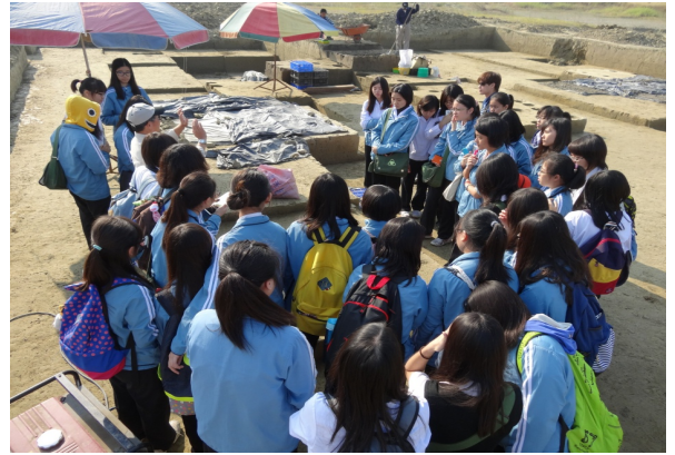
人社課程---南科考古踏查