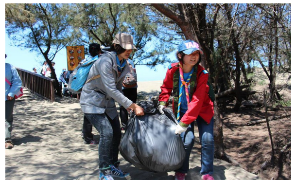
環境教育--淨灘活動