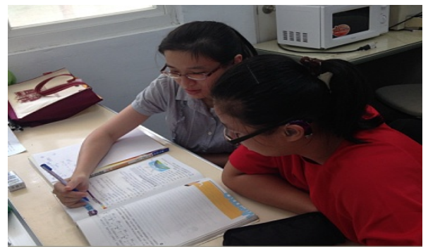
補救教學--學生個別化課程