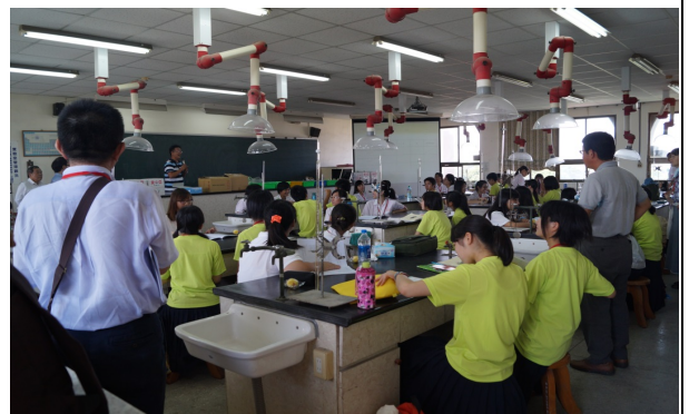
日本龍野高校入班進行實驗交流