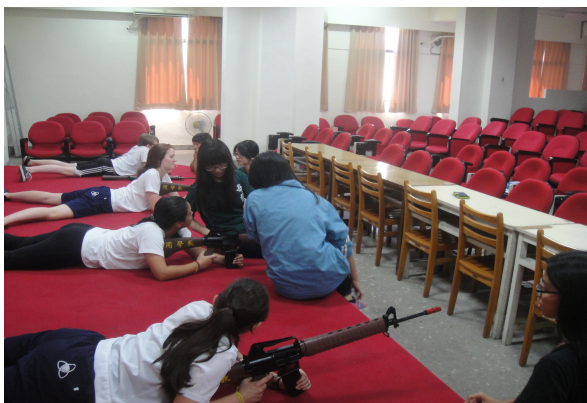
外籍學生體驗全民國防軍事打靶課程