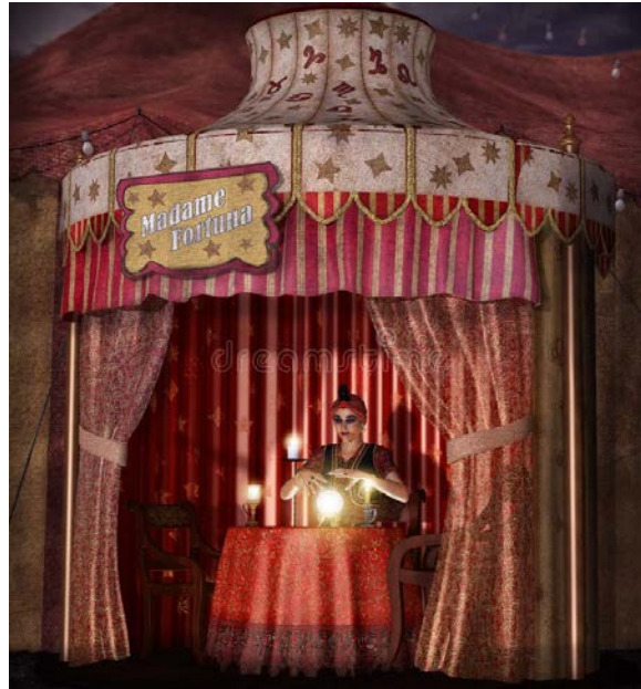
(此為示意圖，成品歡迎親自至現場參觀)

本區將設置諮詢師以及 DISC 測驗，讓民眾能自行領取題目施作測驗，在獲得結果之後由專業職涯諮詢師為其解開關於職涯上的各種疑問，並於觀展結束後領取紀念品。