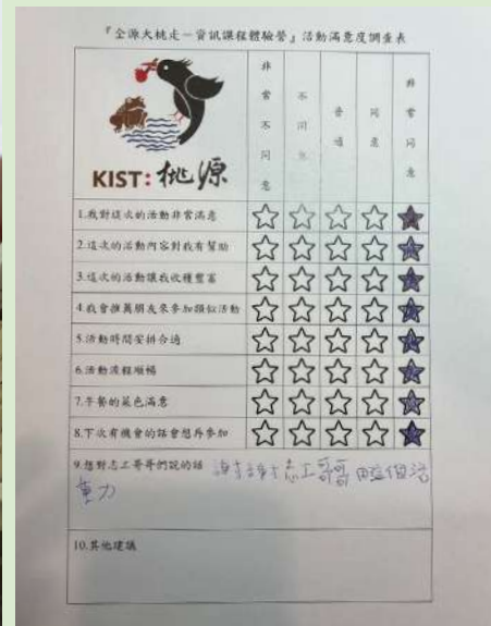
▲ 古文偉小朋友留下了對大哥哥們的感動