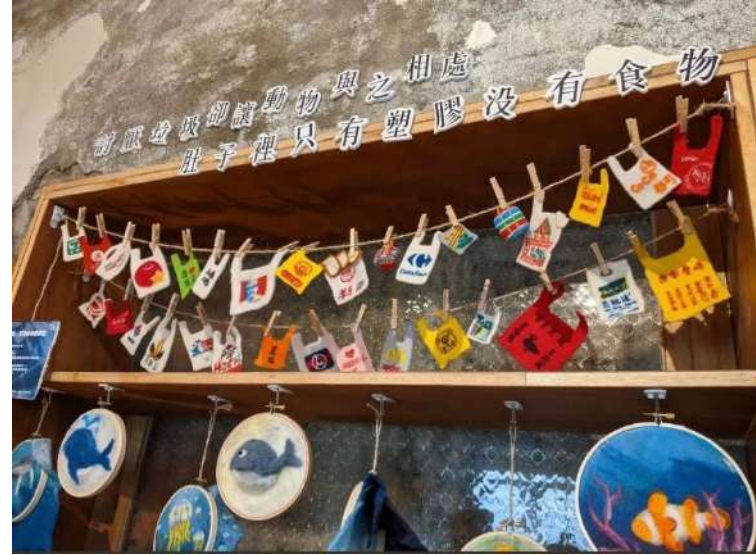
▲ 環保議題牆面細圖

到了採訪尾聲，又到了分別的時間點，在推開門扉走出店面的瞬間，小記者下意識問了老闆自己心中的疑惑：「雖然很想再更瞭解大觀園中承載的歷史，但總是會擔心一味的好奇探索造成附近住戶的困擾。」面對小記者突如其來的想法，老闆告訴了小記者，不只有大觀小弄，大觀園中的烏園、瓦溝橋，好多好多的空間其實都暗藏著屬於它們的歷史故事。與其坐著說自己多麼好奇，不如就主動去跟附近的居民互動和聊天，大家其實都不藏私，很樂意分享自己的經歷，就像老闆前面提及： 我們就像是個容器，裝載著許多內容，你進到裡頭想要收穫些甚麼，可以自己去選擇。 語畢，小記者走出店門，一次又一次的在觀園內穿梭，走到一名坐在烏園歇息的老人面前，開口說道：「您好，我是中原服務學習記者團的小記者，我很好奇……」