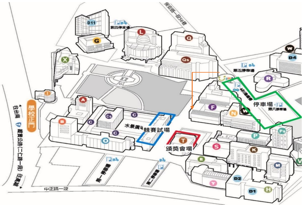
圖1、活動會場動線圖