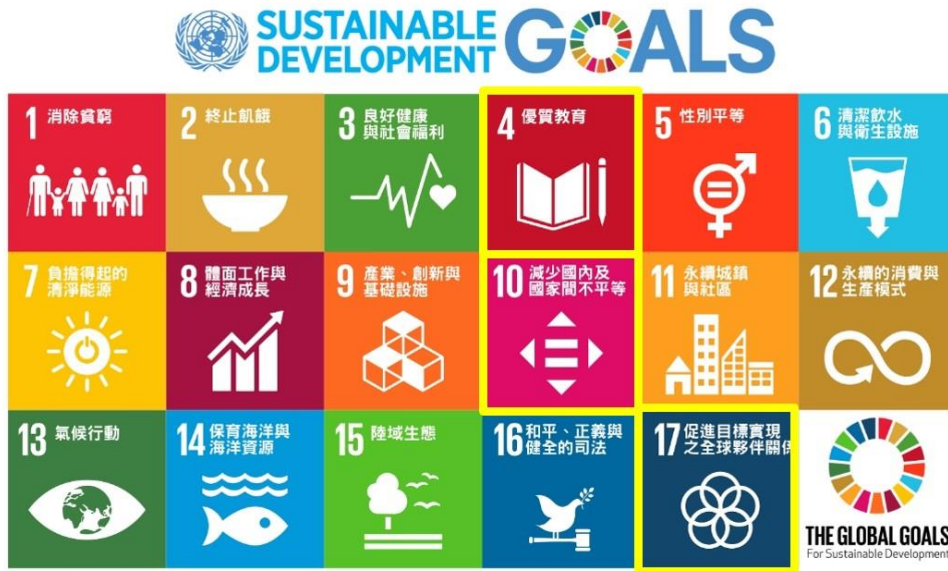
圖 1. 本次活動連結永續發展項目之 4、10、17 項

同時本次活動希望提倡族群平等共融、培養參與學生社會實踐素養，以及做為大學善盡社會責任之表現，本次活動同時與聯合國永續發展項目 (Sustainable Development Goals, SDGs) 進行連結，相關結合目標說明如下：