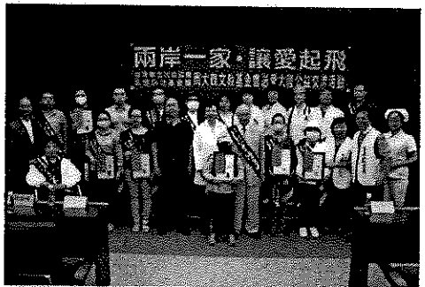
兩岸一家·讓愛起飛—周大觀文教基金會送愛大陸公益交流活動。