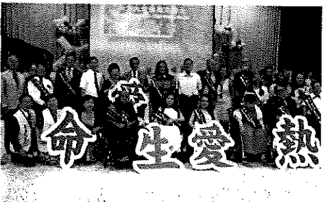
2018年全球熱愛生命獎章得主會師活動。