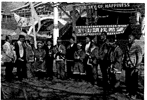
到街頭找希望—台灣生命鬥士為幫助敘利亞難童、貝里斯盲童義演傳愛(台中清水服務區)。