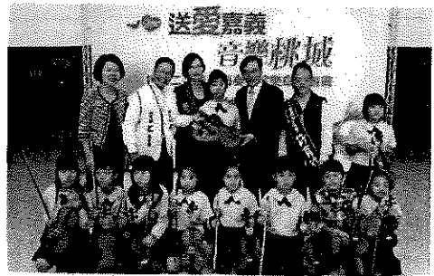
送愛嘉義—捐贈二手樂器再奏希望樂章。