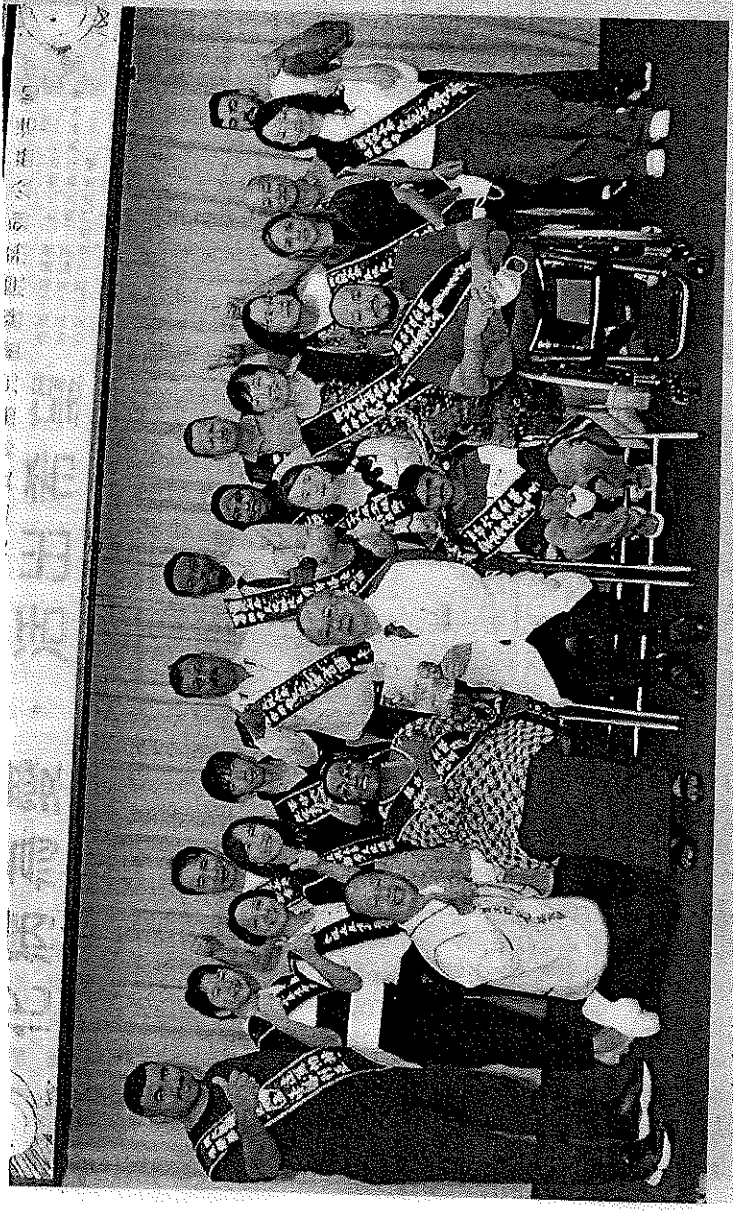
↑ 來自八個國家的二十六位熱愛生命獎章得主齊聚彰基為癌友加油，並贈非洲女力著作。