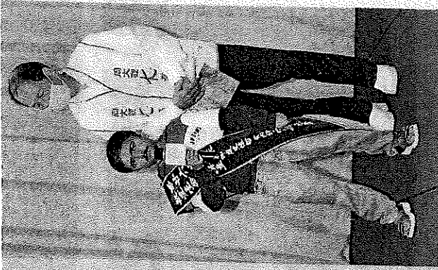
↑ 身高只有九十公分的印度醫師賈內許·維薩拜·巴萊亞，立志為最窮病人服務。