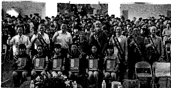
用閱讀激勵生命—永續送書香下鄉讀書希望系列公益活動。