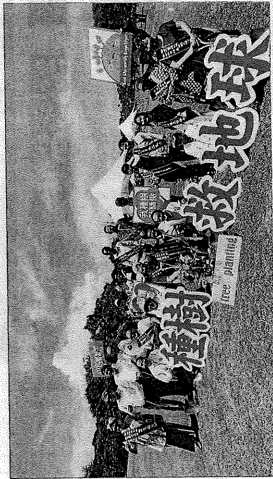
↑周大觀文教基金會主辦二〇二三年全球熱愛生命獎章得主，十六日會師新北市貢寮區種下希望之樹，帶動熱愛生命。

二十多年來，她和科學家悉心打理下，塔中植物園日漸興盛，他們先後從南北疆和寧夏、甘肅、青海、非洲等地引進四百多種植物。不但被運用到了塔里木油田各作業區防護林中，並成功地推廣到南疆鐵路等防沙綠化工程中，完成「土庫曼斯坦阿姆河右岸天然氣專案綠化工程」。