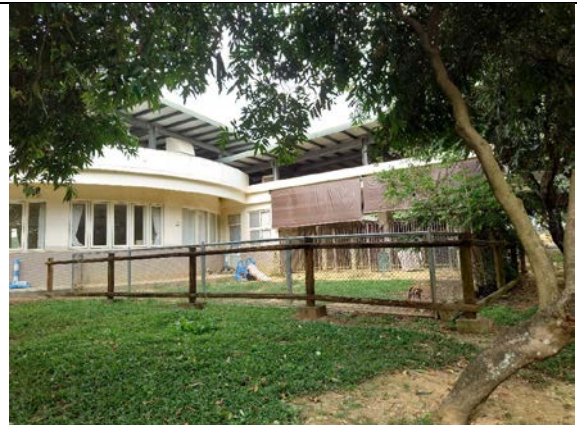
狗狗散放草地外觀