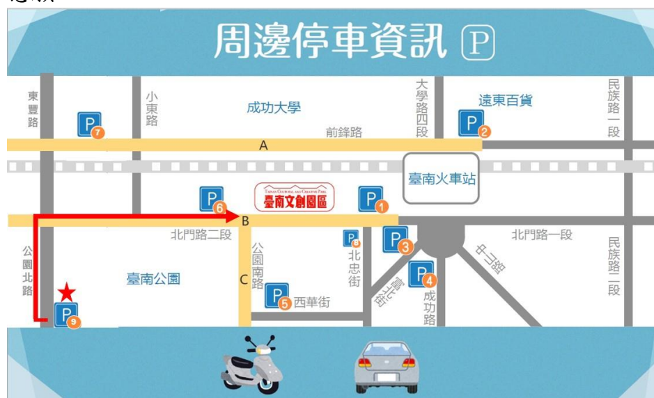
圖 1、臺南文化創意產業園區之周遭停車資訊

(五) 讓臺南地區學校認識台美生態學校以及認證系統操作、經費申請說明，並邀請擁有辦理生態學校經驗老師分享經驗，增進臺南地區教室生態學校認證意願。