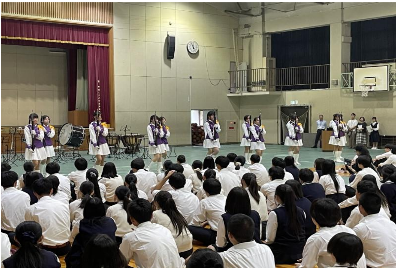
台南女中赴日共演音樂會締結台日青春友誼。